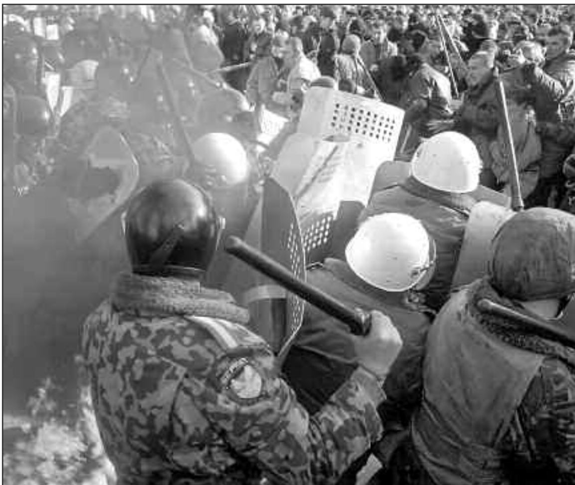
Кульмінація подій 9 березня, силове протистояння учасників протесту та міліції біля стін Адміністрації Президента.