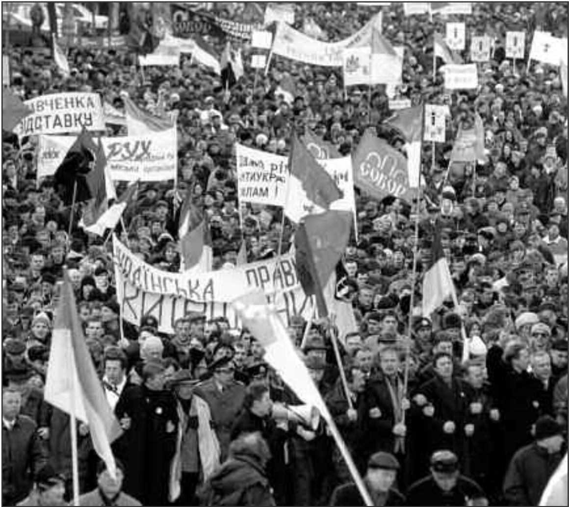
Учасники акції опозиції з прапорами і транспарантами рухаються центром Києва в п'ятницю, 9 березня 2001 року.