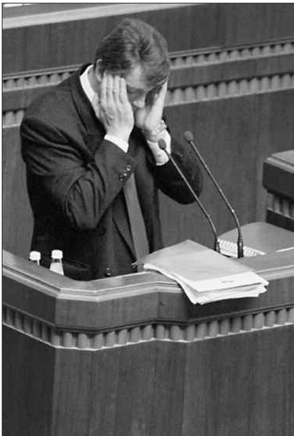
Ющенко на трибуні Верховної Ради у день відставки його уряду.