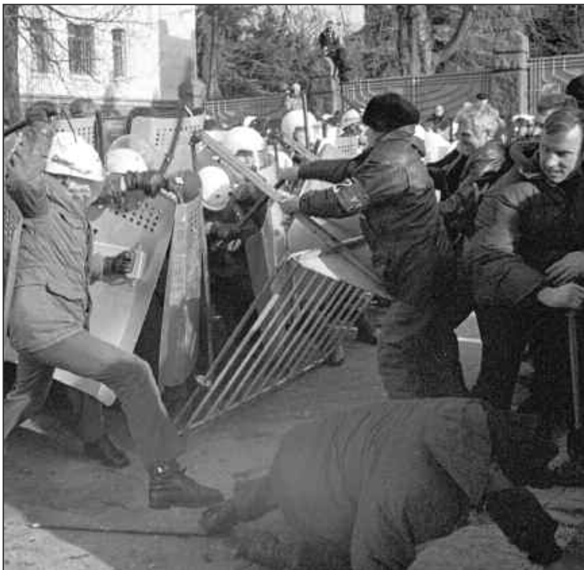
Учасники протесту намагаються прорватися через кордони міліції до Адміністрації Президента.