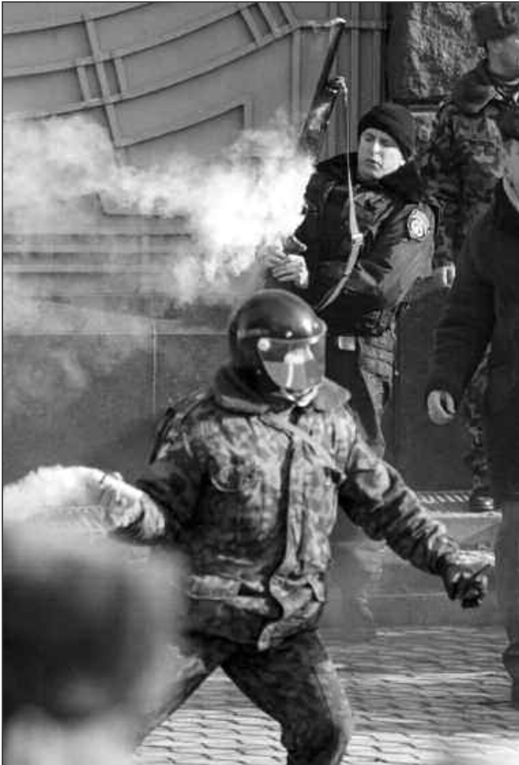
Міліція застосовує проти учасників протестної акції сльозогінний газ.