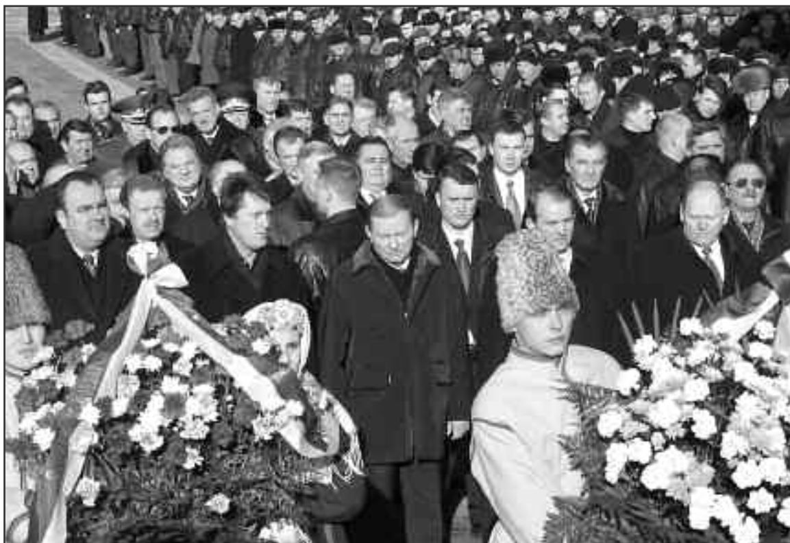
Керівники держави, відмежовані від демонстрантів кордонами міліції, покладають квіти до пам'ятника Тарасу Шевченкові 9 березня 2001 року.